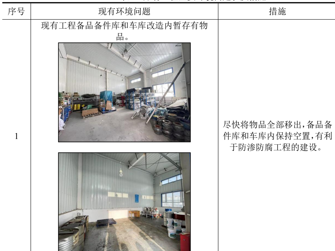
表 9 原有工程主要环境问题以及措施

本项目为危废暂存库由现有的备品备件库和车库改造，现有车库及备用备件库为钢结构，其中由备品备件库改造的危废暂存库面积为 99m 2 ，由车库改造的危废暂存库面积为 45m 2 。租赁厂房现为空置状态，根据现场踏勘，原有工程存在的主要环境问题以及措施，见下表。